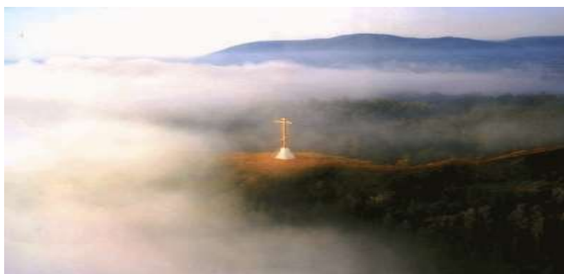
На фото: Царёв Курган с высоты птичьего полёта.

Знакомство с Царевым Курганом одно за другим открывает пласты времени. Возраст его около 300 млн. лет. Окаменелые морские ежи, лилии, моллюски, ракушки, свидетельствуют о том, что когда-то Царев курган был дном Аральско-Каспийского моря. Обитали на нем древние скифы, что подтверждают обнаруженные на кургане селища и оружие этих народов. Служил купол кургана и обителью монастыря. Подземные ходы в недрах кургана, вероятнее всего, служили монахам. Это, пожалуй, самое окутанное легендами и былями место в нашем краю. По преданиям, Тимур (Тамерлан) со своим войском в течение 28 дней отмечал на нем свою победу над Тохтамышем, покрыв курган золотой парчой, как роскошной царской шапкой. Стенька Разин облюбовал это место для венчания с княжной и даже клад где-то закопал. Именно здесь рисовал свою знаменитую картину «Бурлаки на Волге» Илья Репин. В 1824 году на Курган поднимался Государь Император Александр I. Дважды побывал на этой горе и Петр I. Он выложил на кургане свое имя, срубил деревянный крест и поставил на вершине.