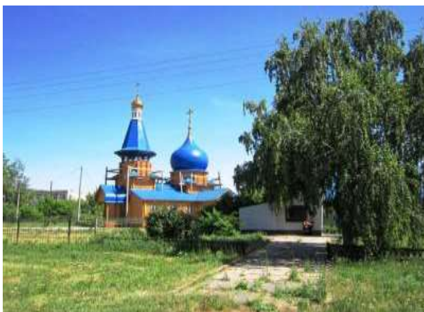
На фото: Храм Михаила Архангела в селе Большая Каменка

В 2009 году первый раз за долгие годы местные окрестности освятил целебный звон церковного колокола. Большая Каменка начала возрождаться. Возрождение храма Михаила Архангела вернуло гармонию в сердца людей, словно солнечный лучик надежды, постепенно смывающий, наконец, это черное пятно с нашей совести.