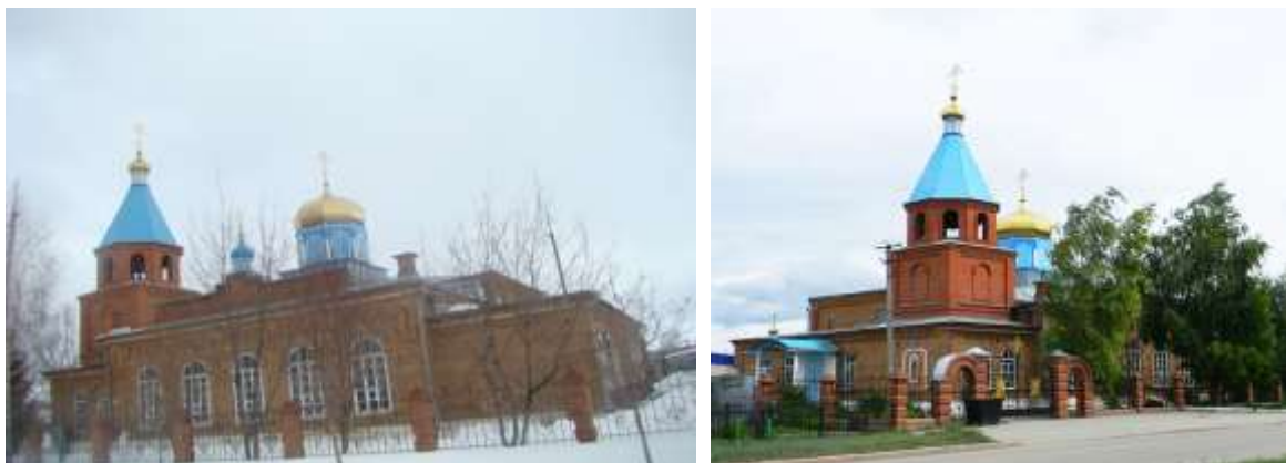
На фото: Храм Михаила Архангела с. Красный Яр.

Васильев. И, наконец, в октябре на храме снова закрасовался златоглавый центральный купол с крестом, обращенным на восток.