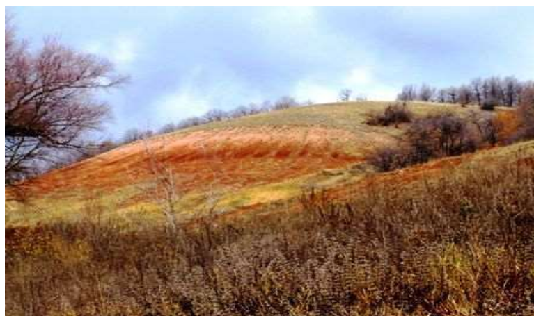
На фото: Гора Красная близ села Большая Каменка

Гора Красная – памятник природы регионального значения.