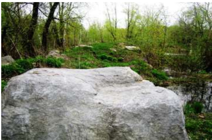
На фото: Храм Перуна

Два кольца, насыпанные из песка, соединение Солнца и Луны – Солунь (космический символ россов) – два вала, на вершине которых многотонные каменные изваяния с характерными следами древних скульпторов. Многие камни арочной формы, при этом, стоячие и строго ориентированы по сторонам света.