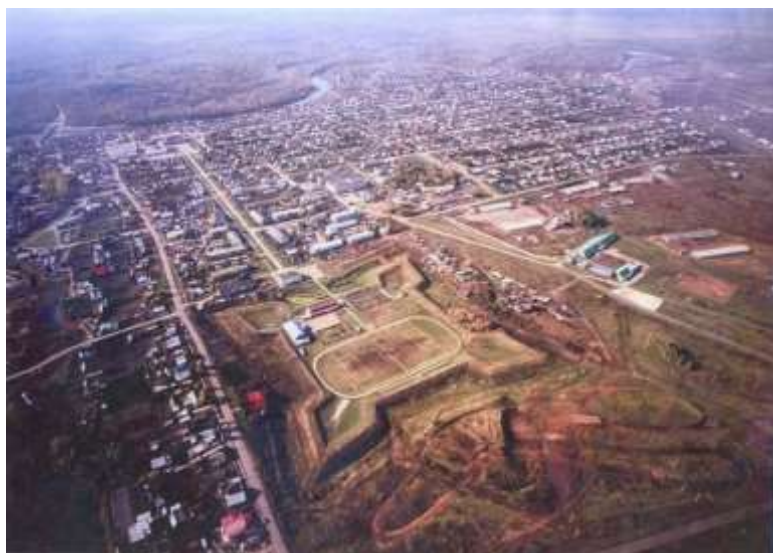
На фото: Село Красный Яр с высоты птичьего полёта