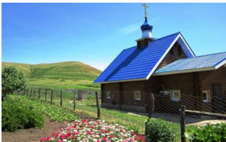
На фото: Часовня с купелью в селе Русская Селитьба.

В 1998 году в Русской Селитьбе построили красивую деревянную часовню, купель, благоустроили прилегающую территорию. В январе 1999 года архиепископ Самарский и Сызранский Сергей освятил источник. Вскоре после этого люди увидели в небе над источником большой розовый крест.