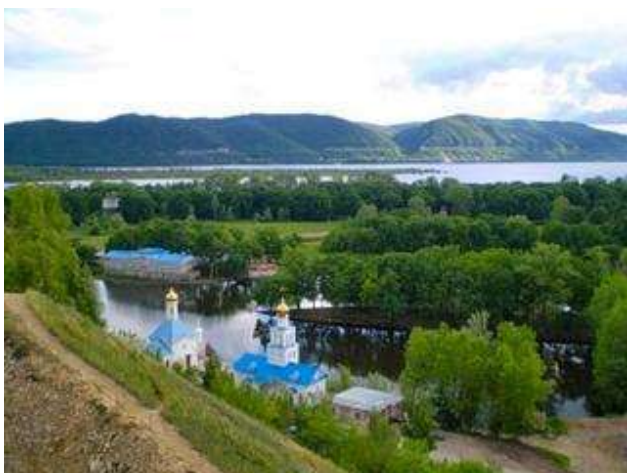
На фото: Вид с Царёва Кургана на Царевщинское озеро.