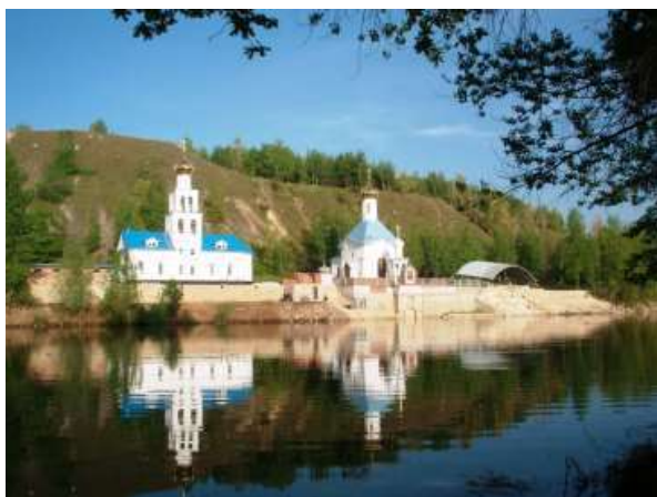
На фото: Источник в честь иконы «Неупиваемая чаша».