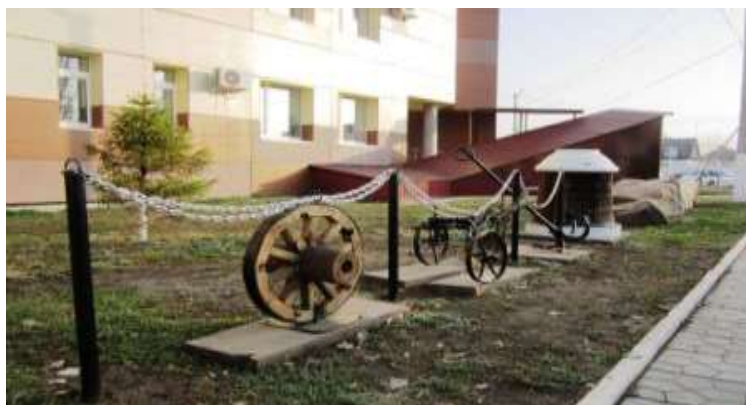
На фото: Экспонаты музея истории Красноярского района.

Год назад открылась музейная гостиная «Серебряное крыло». В полотнах местного художника Александра Малыгина из поселка Мирный оживают многие значимые исторические события Красноярского района.