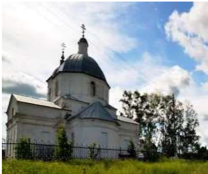
На фото: Русскосельбенский храм.

В 1989 году началось восстановление храма. 4 марта в 1992 году храмовые службы возобновили. В церкви сохранилось множество старинных, намоленных икон, зачастую мироточащих, сердечное обращение к которым помогает и исцеляет.