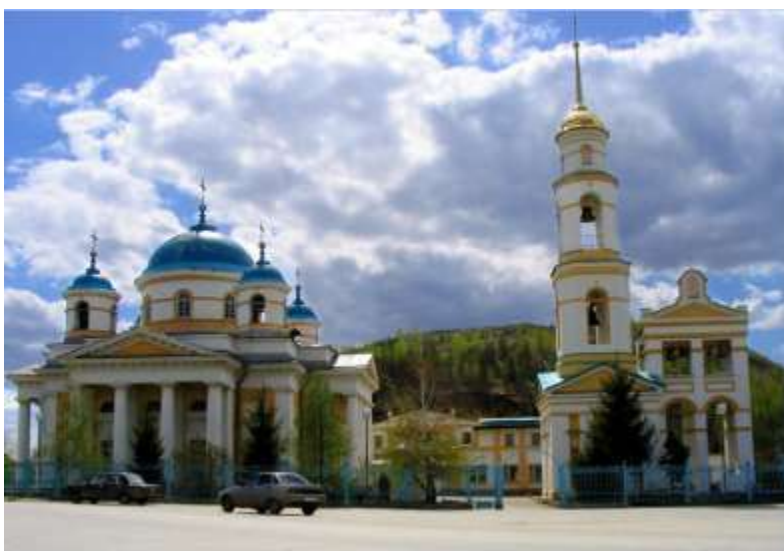
На фото: Христорожественская церковь.

Но самый явный след на кургане оставила советская власть, безжалостно его раскурочив. Здесь в течение десятилетий добывали камень. И, хотя Царёв курган лишился половины своей высоты, он и сегодня не оставляет равнодушным. В честь 1000-летия крещения Руси на кургане был установлен поклонный крест. Удивительное совпадение - вертолёт для установки дали на праздник Крестовоздвижения. Тот день выдался ненастным, но во время воздвижения креста на вершине холма образовался оазис тишины, залитый солнечным светом. Через несколько дней чудесного воздвижения один из вертолётчиков крестился в местной Христорожественской церкви.