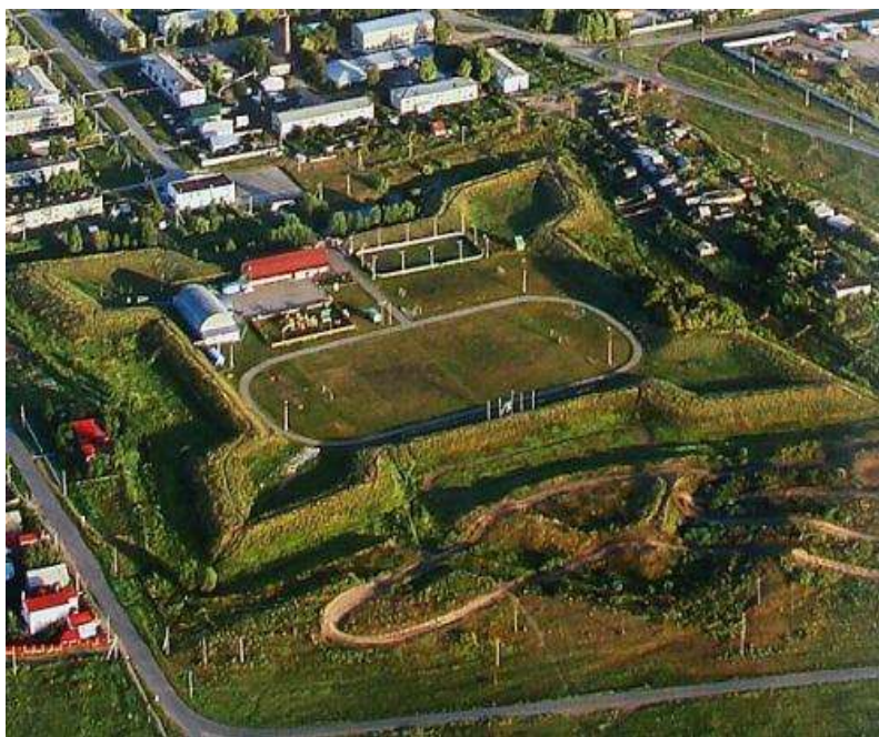
На фото: Красноярская крепость с высоты птичьего полёта

На строительство привлекались крестьяне из Казанской и Нижегородской губерний. Были собраны и квалифицированные строители - мастера для возведения казарм, караульных домов, мостов. В Красноярской крепости трудились кузнецы, плотники, столяры, слесари, печники, токари, каменщики. Вокруг крепости постепенно образовалось целое поселение. Красноярская крепость - памятник федерального значения.