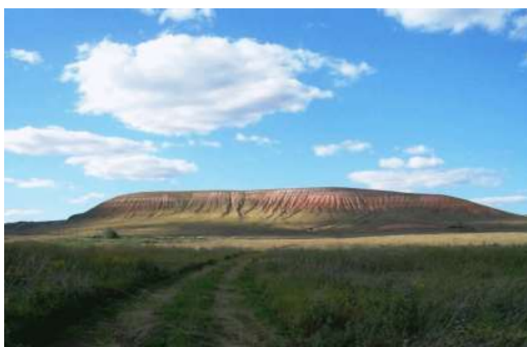
На фото: Лысая гора в районе с. Большая Раковка

По дороге в Большую Раковку еще издали бросается в глаза исполинских размеров гора, одиноко стоящая в степи и вззирающая на окрестности. Из-за голой вершины называют жители ее Лысой. Гора, как и весь массив Сокских гор, сложена пермскими породами палеозоя, возраст которых около 250 млн. лет. Обычно древние субстраты являются местом произрастания реликтовых растений. Здесь можно встретить астру альпийскую, клаусию солнцелюбивую, бурачок ленский, тонконог жестколистный, ковыль Коржинского, эфедру двухколосковую, полынь солянковидную, скабиозу исетскую. На склонах горы распространены разнотравно-типчаковые степи. Часто можно наблюдать, как парaplаны с Лысой Горы поднимаются ввысь и парят над Раковкой. Сегодня Лысая Гора является памятником природы.