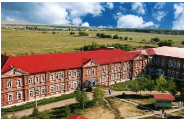
На фото: Женский монастырь в Красном городке близ села Большая Раковка

которого вскоре уже зачернели пашни, синяя лента реки Сок, вплетенная в ромашковые косы пойма – все радовало глаз! А еще в многочисленных озёрах и маленьких речушках водилось много рыбы и особенно раков. Одна речка даже получила название Раковка. Так у Сокского посёлка появилось название - Большая Раковка. В 1769 году в селе была открыта церковь.