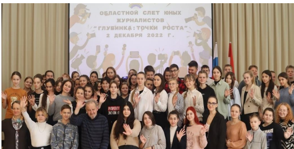
На фото: Участники «Педагогического баттла» и Слёта юных журналистов (28.10.2022 и 02.12.2022, с. Красный Яр)